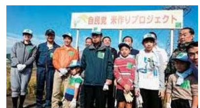
自民党米作りプロジェクトで東京都青海市での稲刈りに参加