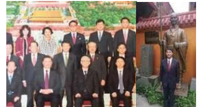
人民大会堂での記念撮影 最前列に習近平・国家主席