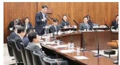
参議院農林水産委員会 で農水大臣等に対し質問