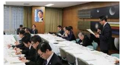
自民党農業基本政策検討委員会で多様な土地改良区の現場の意見反映を強調