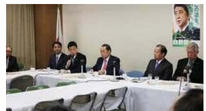
自民党農村基盤整備議連にて