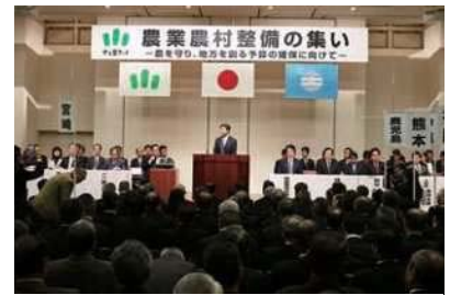
「農業農村整備の集い」にて