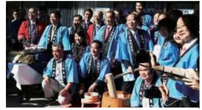
自民党米作りプロジェクトの収穫祭に参加