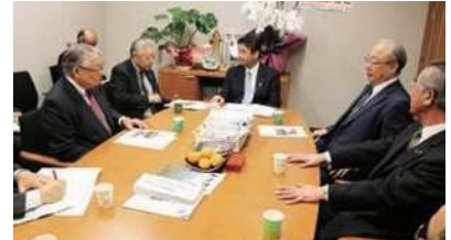
事務所で青森県土連の皆さんと意見交換