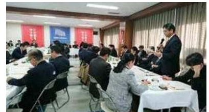
自民党農林関係合同会議、水産関係合同会議で平成29年度補正予算(案)の主要項目について意見