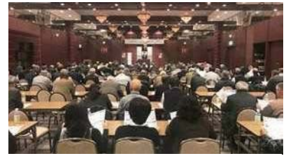
愛媛県土連役員研修会で講演