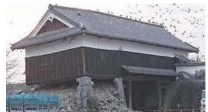
自民党女性局の熊本地震被災地視察で復興工事を待つ熊本城