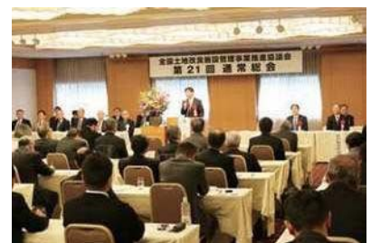
全国土地改良施設管理事業推進協議会通常総会にて