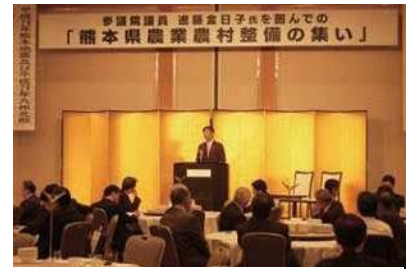
熊本県農業農村の集いに出席