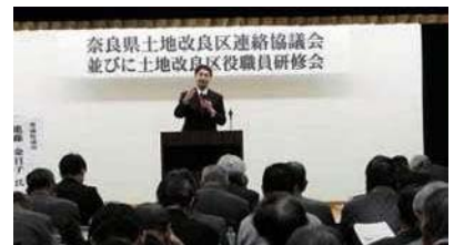
奈良県で土地改良連絡協議会等の研修会で講演