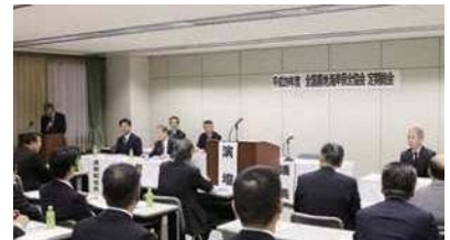
全国農地海岸保全協会総会に出席