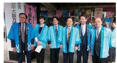
自民党本部前での岡山フェアに出席