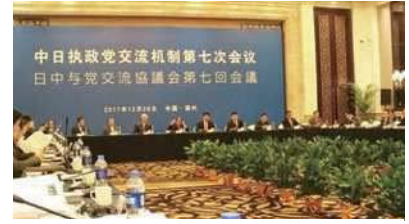
福建省福州市での日中与党交流協議会