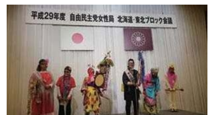
秋田での自民党女性局北海道・東北ブロック会議にて