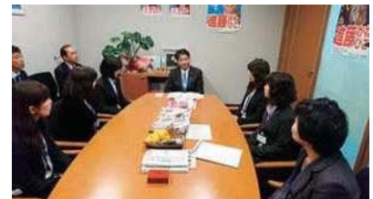
大分県農村女性の会の皆さんと意見交換