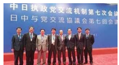
第7回日中与党交流協議会参加メンバー