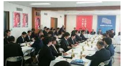
自民党農林合同会議に出席