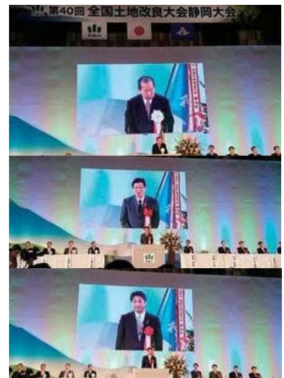
全国土地改良大会静岡大会での二階会長、川勝静岡県知事、私の挨拶