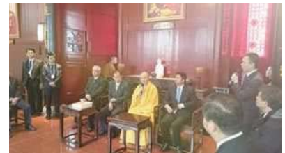
空海大師が嵐に遭い流されて辿り着いた福州で約1ヶ月間滞在して修行した福州開元寺を訪問