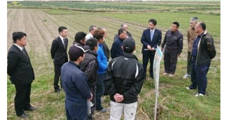
福岡県下の農地整備計画地区で関係者と