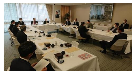
ため池法案検討 PT(第8回)