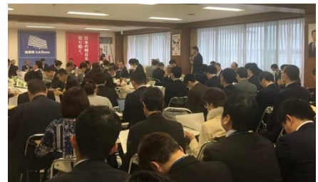
自民党農林部会合同会議で意見交換