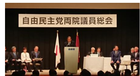
自民党両院議員総会で二階幹事長説明