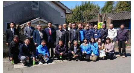
熊本県人吉球磨地域の土地改良関係者と