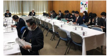
自民党子どもの元気！農山漁村で育むプロジェクトチーム会合