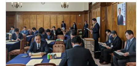
衆議院自民党国会対策委員会で法案説明