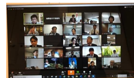
オンライン会議で参議院自民党勉強会