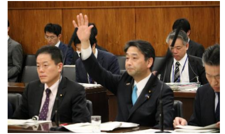
参議院総務委員会で答弁