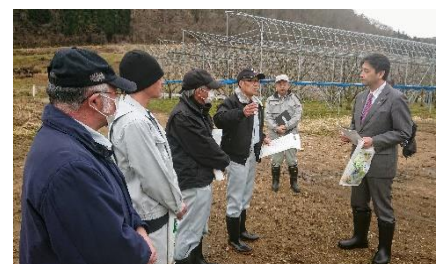
山形県下で土地改良関係者と意見交換