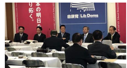
自民党農村基盤整備議員連盟役員会で司会