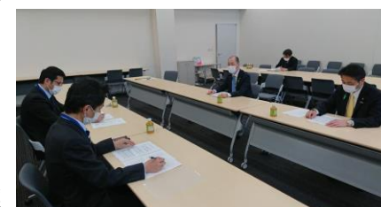
全国土地改良事業団体連合会と意見交換