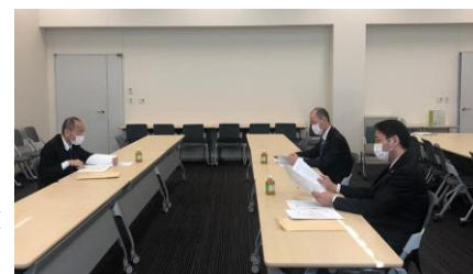
農林水産省幹部と意見交換