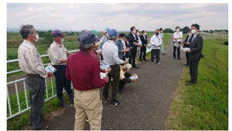
埼玉県下の農業関係者と意見交換