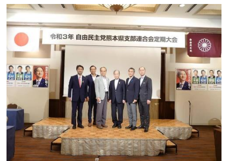
自民党熊本県連の大会にて