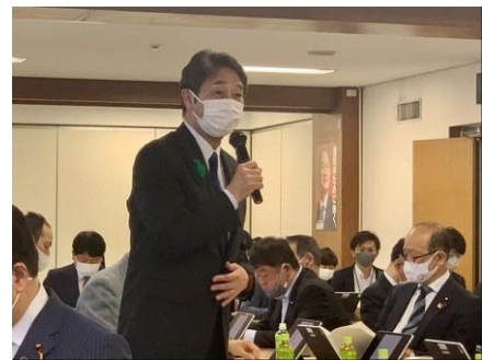
自民党委員会で意見を発言