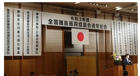
全国離島振興協議会通常総会にて