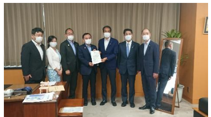
棚田 PT で坂本地方創生大臣に提言