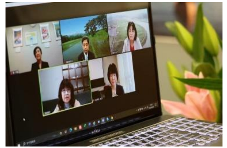
(一社)土地改良建設協会のリモート座談会にて