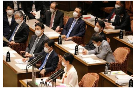
参議院予算委員会にて