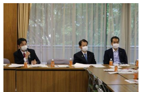
自民党米の需要拡大・創出検討 PT で司会