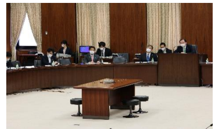
参議院総務委員会に出席