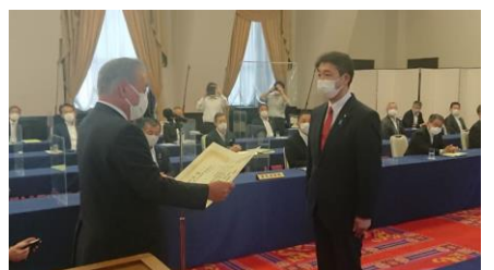
土地改良建設協会から推薦状を拝受