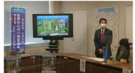
「NHK 朝ドラ「南一郎平」誘致推進協議会にて、南翁の偉業・広瀬井路・平田井路は、世界かんがい施設遺産登録手続き中