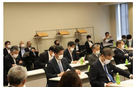
自由民主党卸売市場議員連盟勉強会にて