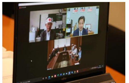
長崎県土地改良政治連盟と自民党長崎県連からリモートで推薦状