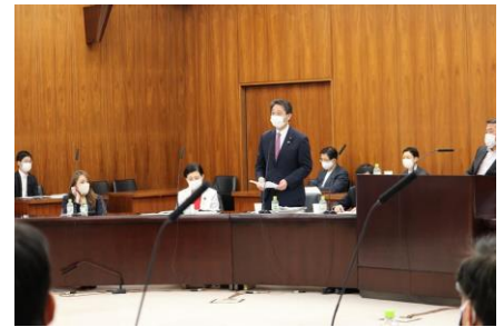
参議院地方創生及び消費者問題に関する特別委員会で質問