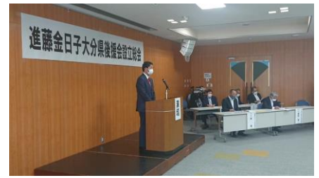
大分県後援会設立総会に出席