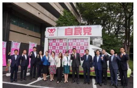
自民党女性局宣伝カー納車式