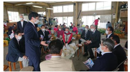
静岡県下で国政報告会を開催