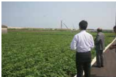
徳島でさつまいもの生育状況を視察