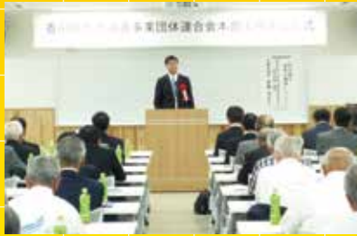
香川での研修会で講演