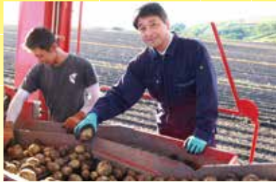
北海道でジャガイモの収穫作業を手伝い