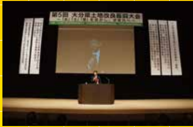
大分県土地改良振興大会で講演

可能な限り全国各地に伺い、国政報告会等を行いながら多くの方々と意見交換をさせて頂きました。各地の農林水産業関係者、女性の皆さん、関係業界の方々等の現地の生の声を今後の国会活動に着実に生かしてまいります。