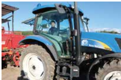
大型トラクターにて