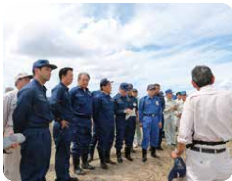
流出した農地の被災状況等を聴取

これから、台風・秋雨の時期となりますが、くれぐれも豪雨等に注意して頂きたいと思います。