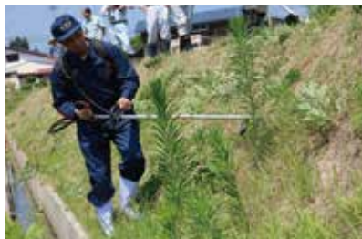
ほ場整備完了地区で草刈り作業を実施