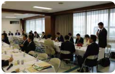
自民党農林水産関係合同会議で予算要求について意見