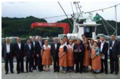
岩手で漁港漁村の現地調査に参加