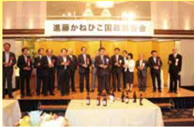
新潟で国政報告会を開催