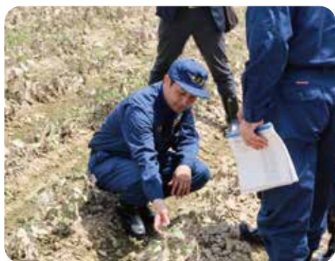
大豆の被害状況を調査