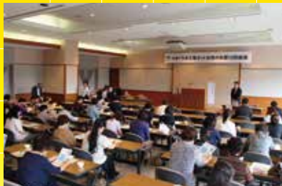
女性の会総会で講演