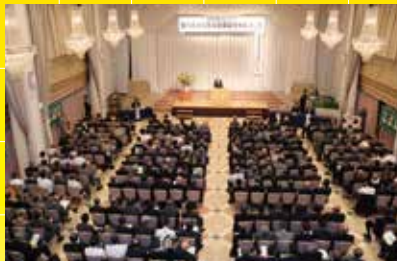
北海道でセミナーを開催