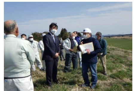
宮城県下の土地改良現地を視察