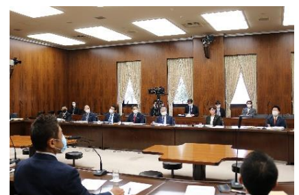
参議院農林水産委員会に出席