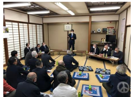
大仙市協和の地元関係者に国政報告