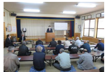
岐阜県下で土地改良関係者に国政報告