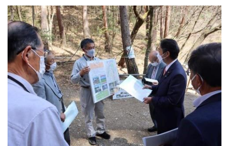
長野県下の林業関係者と意見交換