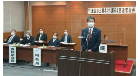
全国土地改良事業団体連合会総会に出席