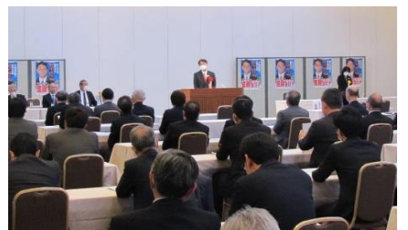
北海道土地改良政治連盟総会で挨拶