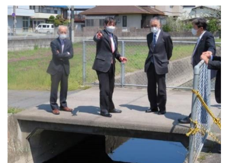
和歌山県下の土地改良施設を視察