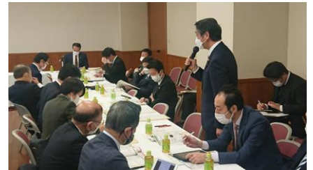
農林部会合同会議で意見