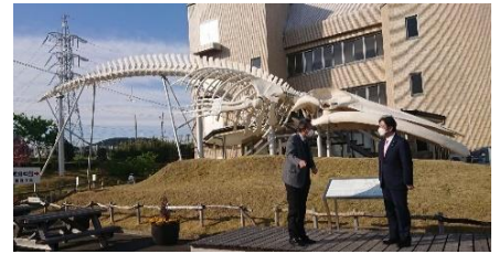
クジラの町千葉県和田浦を訪問