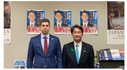
在日ジョージア大使と懇談