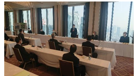
土地改良建設協会理事会で挨拶