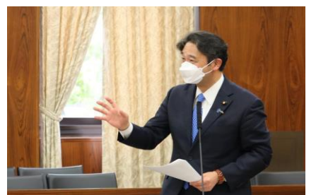
参議院農林水産委員会で質疑