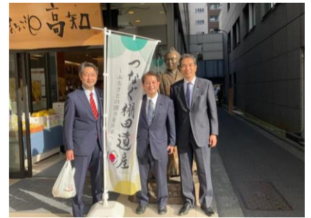
つなぐ棚田遺産フェア視察