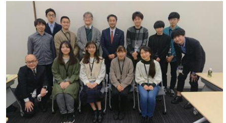
早稲田、東京農業大学の学生と意見交換