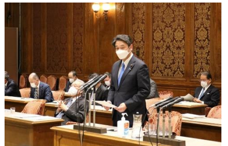
東日本大震災復興特別委員会で質疑